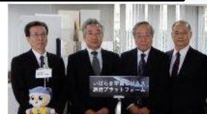
Japan Space Systems

〔例：自社で開発中の人工衛星部品に対する技術的アドバイスを受けたい 地上用機器を宇宙機器に転用するにはどうしたらよいか知りたい 等〕